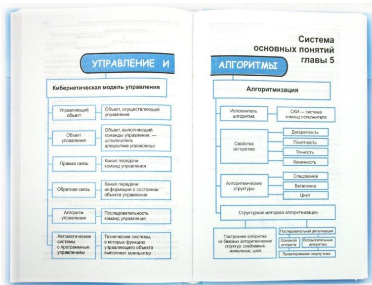
Рис. 2. Система основных понятий главы 5 учебника для 7 класса (автор Семакин И.Г. и др.)

Наиболее часто иллюстрации в учебниках встречаются при изложении тем Алгоритмизация и программирование (построение блок-схем), информационные процессы, коммуникационные технологии (схемы сетей, иерархические структуры), таблицы истинности, графы.