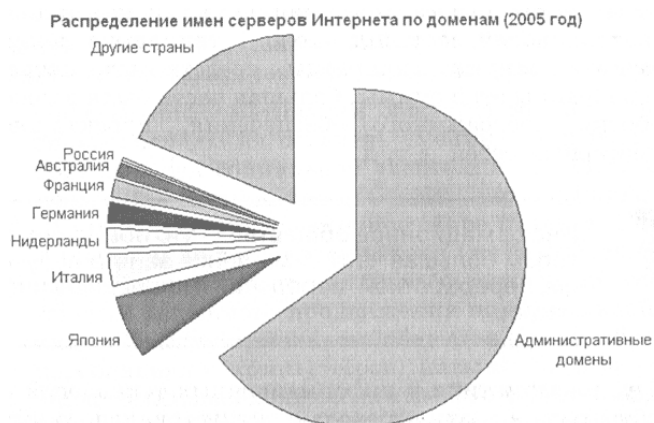
Рис.1. Диаграмма из учебника по информатике для 8 класса Угриновича Н.Д.